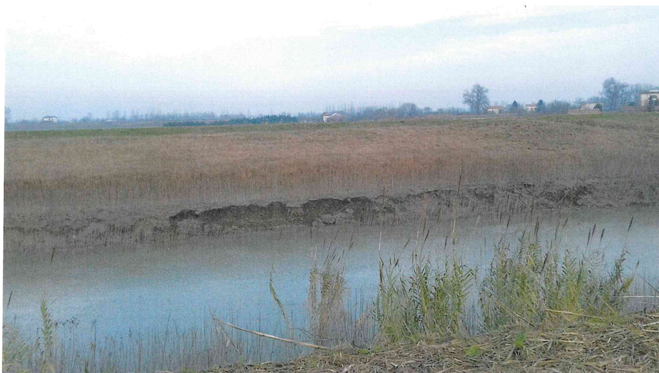
sponda in frana – tratta a valle stanti 5-6sx