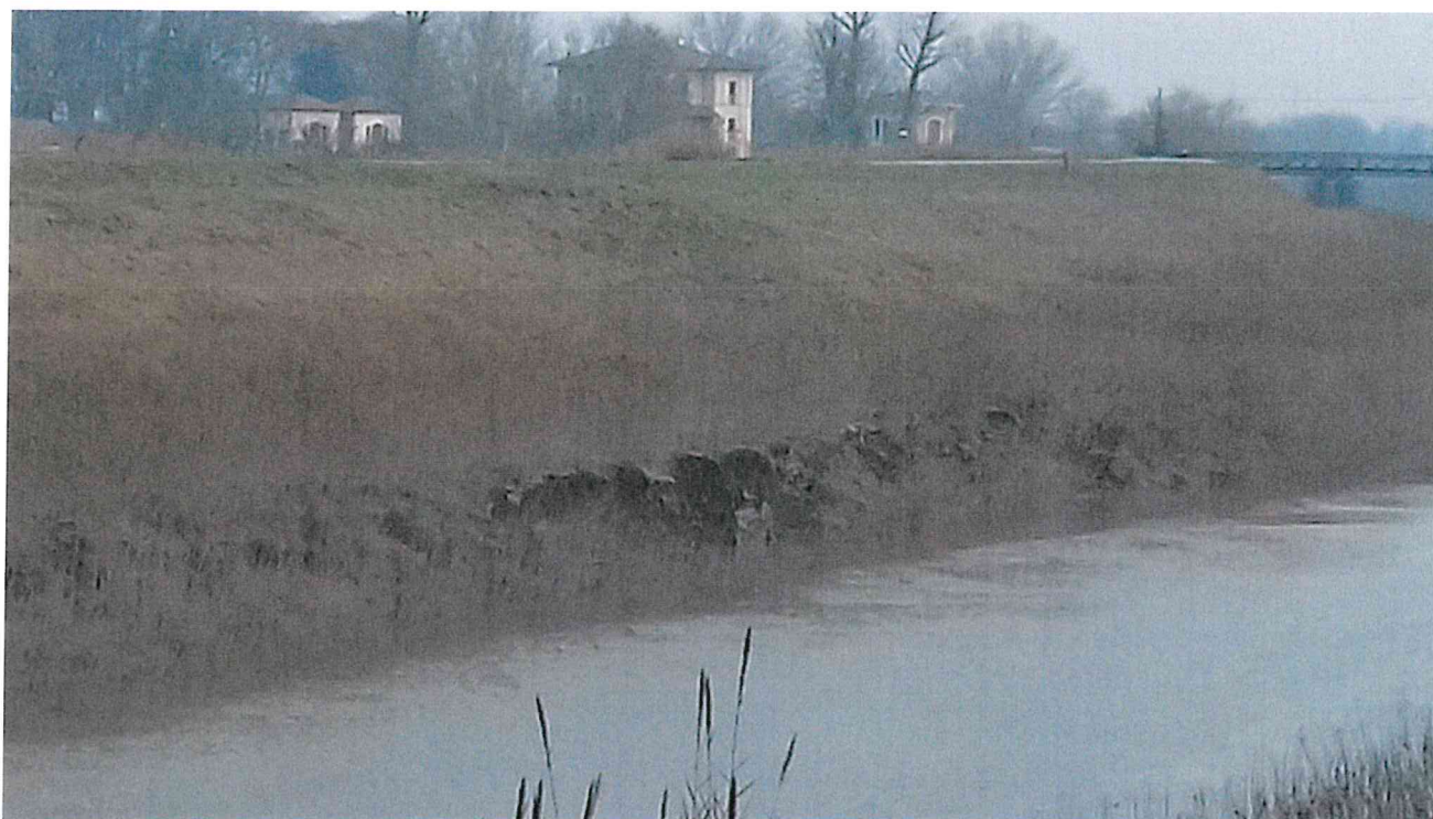
sponda in frana – tratta a valle stanti 5-6sx