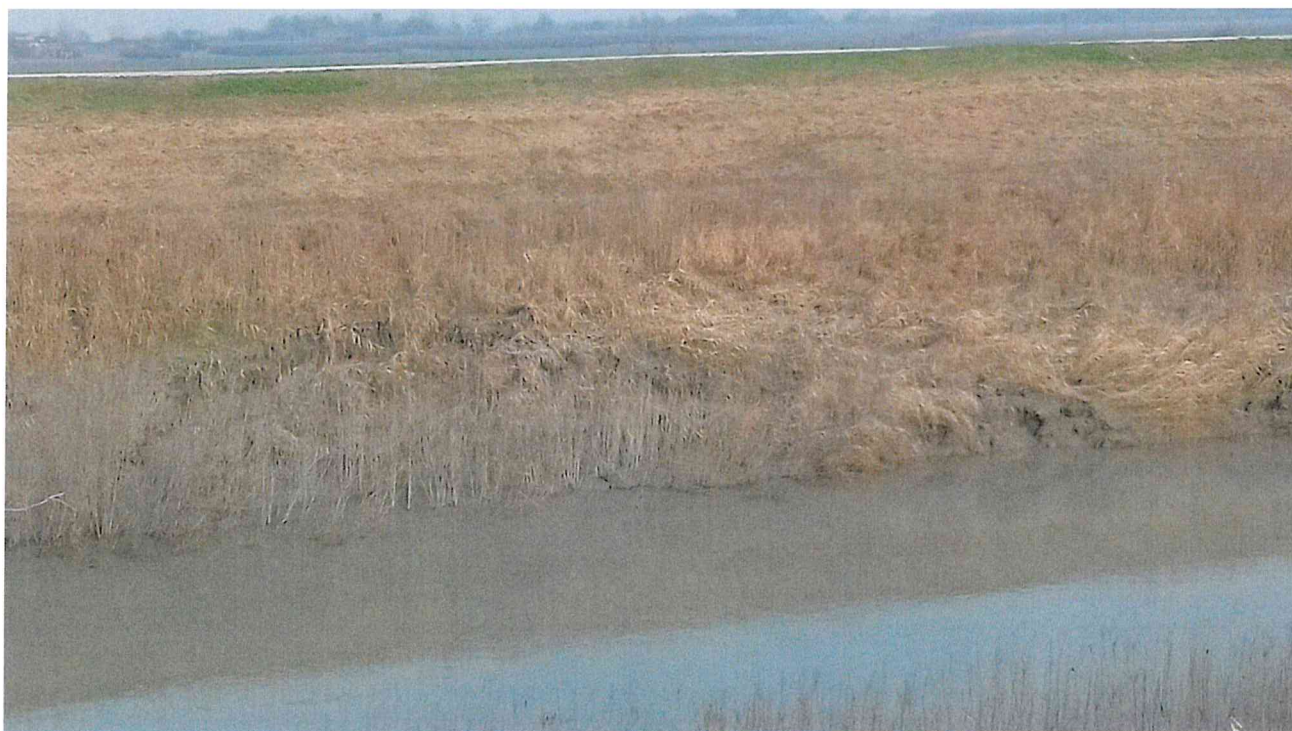
sponda in frana – tratta a monte stanti 0-1sx